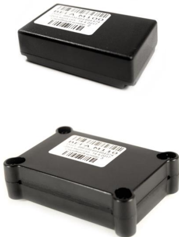
Рисунок 1 - Внешний вид поискового устройства ВЕГА М-100 (сверху) и ВЕГА М-110 (снизу).