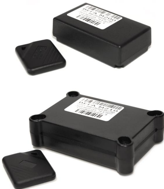
Рисунок 1 - Внешний вид и комплект поставки поискового устройства ВЕГА М-200 (сверху) и ВЕГА М-210 (снизу).