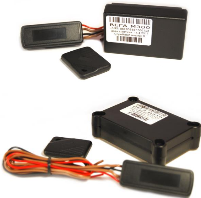
Рисунок 2 - Внешний вид и комплект поставки поискового устройства ВЕГА М-300 (сверху) и ВЕГА М-310 (снизу).